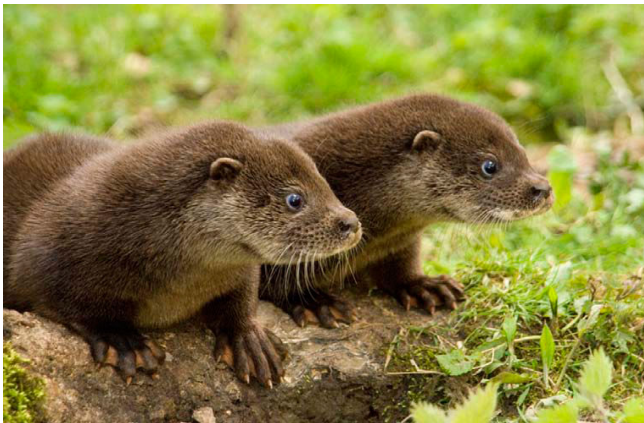
Cuccioli di lontra Eurasiatica; Chestnut Centre, UK.

Traduzione in italiano: Lorenzo Quaglietta